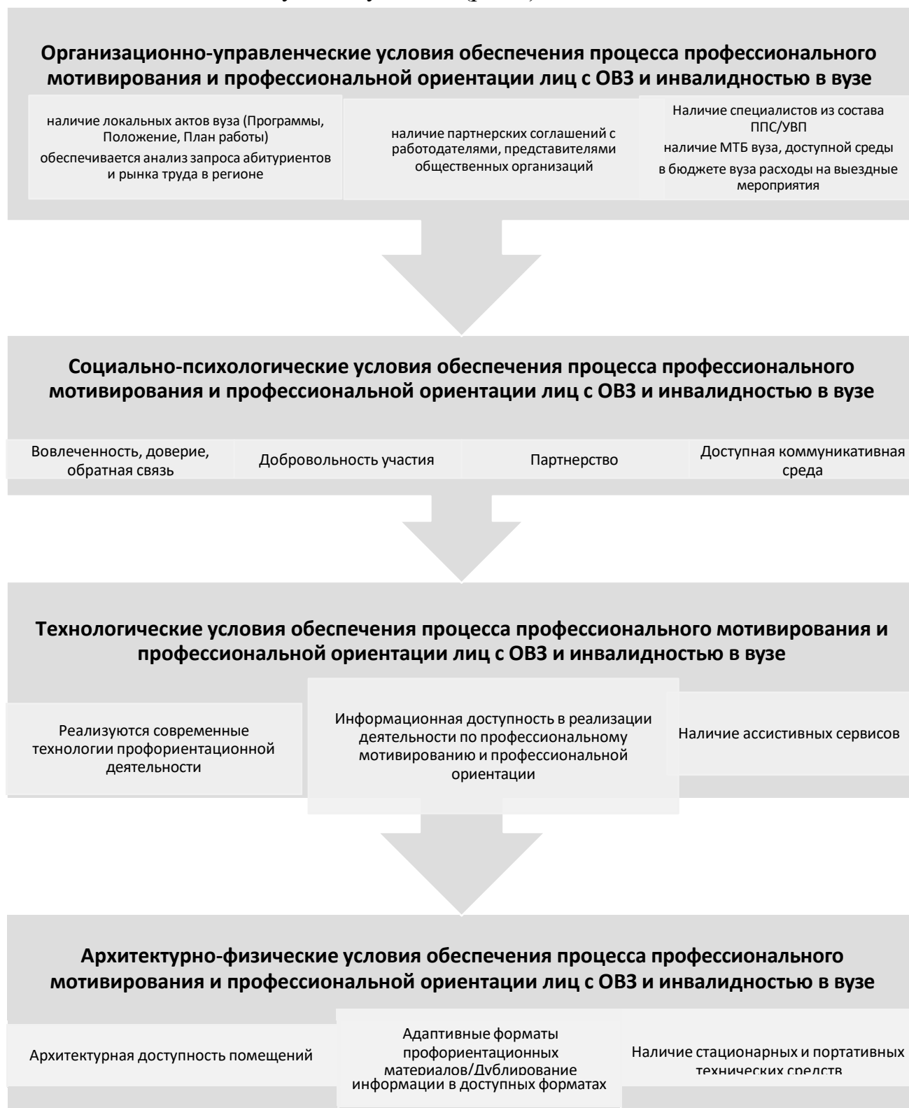
Рисунок 2 – Условия организации и реализации профориентационной работы

При организации профориентационной работы Организацией обеспечиваются следующие условия (рис.2).